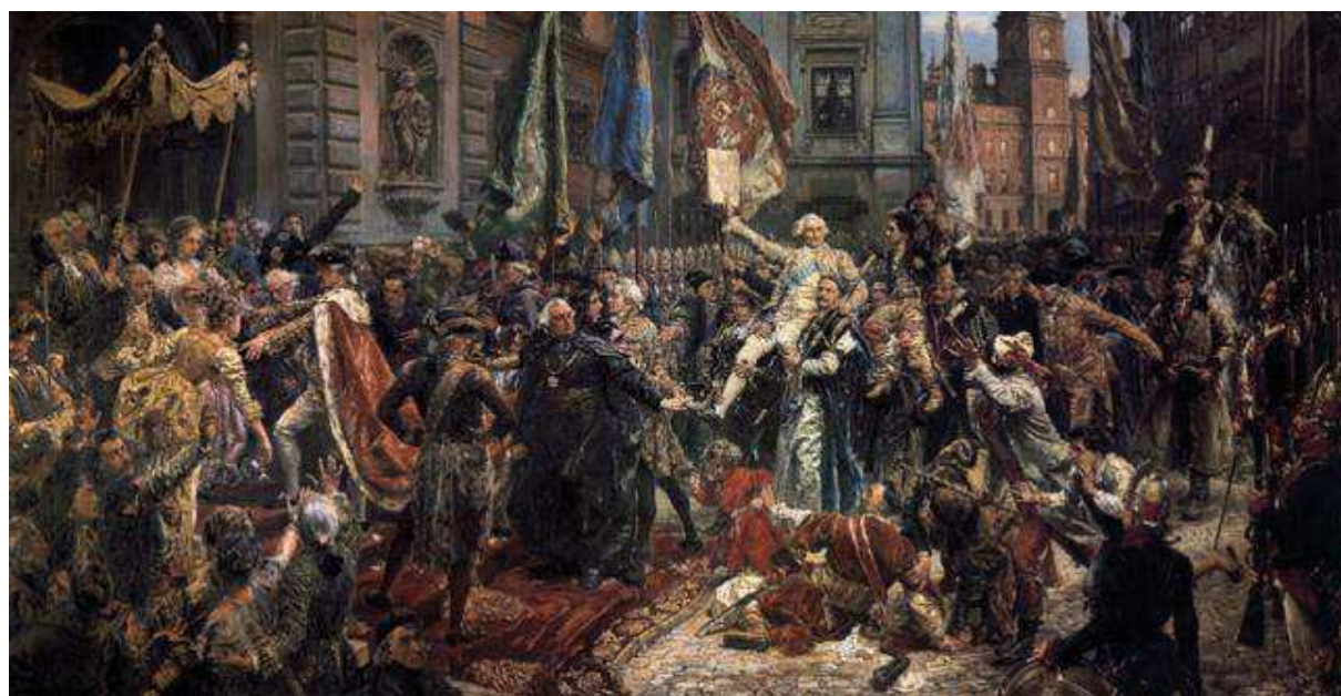
Jan Matejko Konstytucja 3 maja

W 1791 roku dzień 3 maja został uznany za Święto Konstytucji 3 maja. Po drugiej wojnie światowej ówczesna władza zakazała świętowanie tego dnia. Dopiero po zmianie ustroju w Polsce w 1990 roku dzień 3 maja obchodzony jest na nowo, jako NARODOWE ŚWIĘTO KONSTYTUCJI .