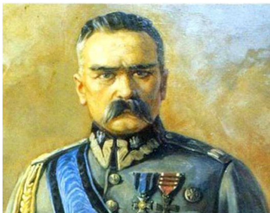
Józef Piłsudski (1867-1935),

żołnierz, polityk, twórca Legionów Polskich, naczelnik państwa, pierwszy marszałek Polski, premier Polski (1926-1928, 1930).