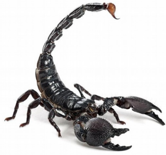
Pancerz i ogon skorpiona