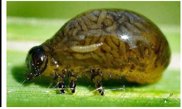
larwy osy zjadają chrząszcza od środka