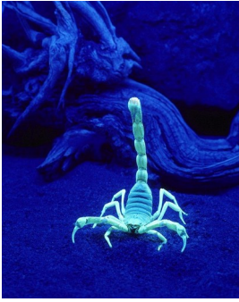
Ten skorpion do złudzenia przypomina twarząlapa