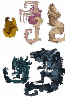
cykl rozwoju obcego jako rysunki majów