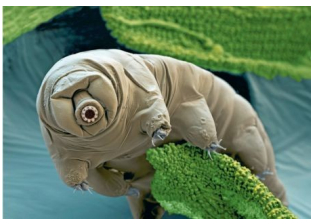
nieszporzak na mchu